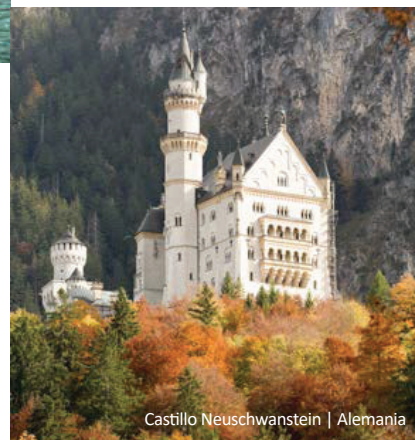
Castillo Neuschwanstein | Alemania

9 Viena Traslado privado al aeropuerto o estación de tren. Fin de nuestros servicios.