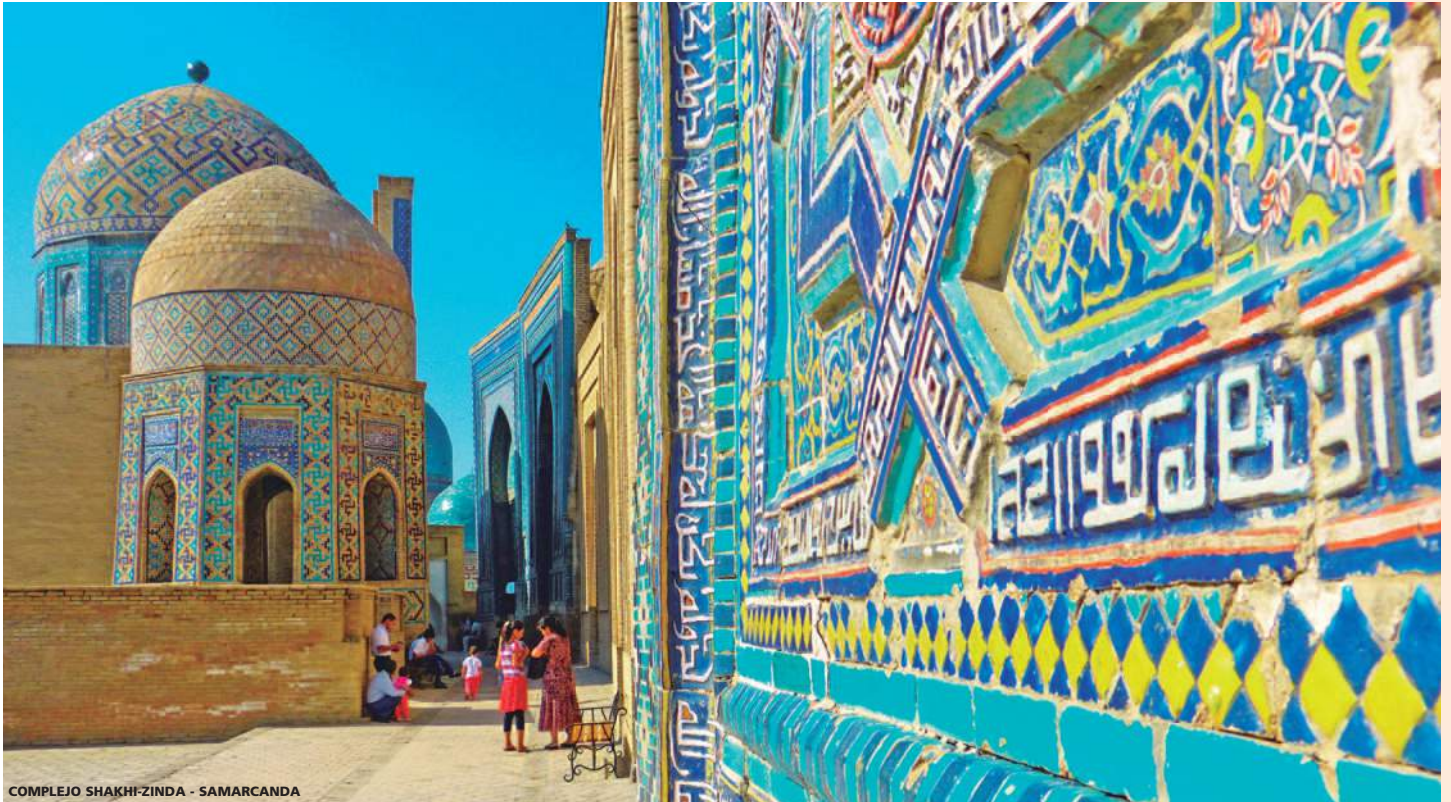
COMPLEJO SHAKHI-ZINDA - SAMARCANDA

9 días (8 noches de hotel) desde 1.499 USD