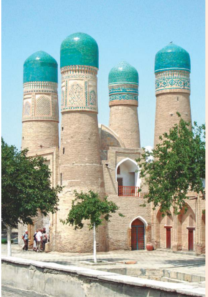
CHOR MINOR - BUKHARA

A la hora indicada, traslado al aeropuerto de Tashkent.